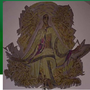
Muurschildering kerk Leveroy