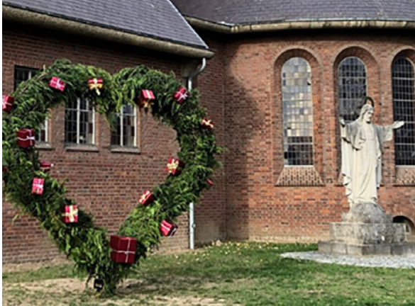
H. Hartbeeld kerk Baexem met hart