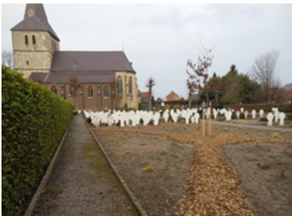
Begraafplaats strooiveld kerk Grathem

Het clusterbestuur zal zich des te meer inzetten om de positieve lichtpuntjes van het afgelopen jaar ook in de komende jaren te laten branden. Wij danken iedereen voor zijn of haar bijdrage.