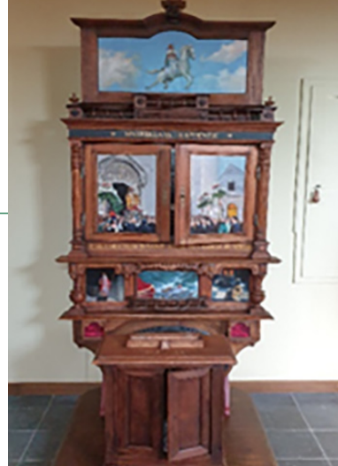
Nicolaasretabel kerk Heythuysen

Voor u ligt de tweede uitgave van onze gemeenschappelijke parochiegids van ons cluster Tabor. We kijken terug op een zeer bewogen jaar 2020 waarin we in de greep kwamen van het coronavirus. Een onzichtbare vijand die invloed kreeg op zowel ons lichaam als onze geest.